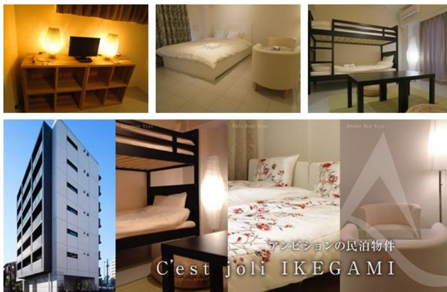
『セジオリ池上(C'est joli IKEGAMI)』

※国家戦略特区を活用した「特区民泊」を全国で最初に導入した東京都大田区は2017年10月18日、利用できる条件を「6泊7日以上」から「2泊3日以上」に短縮すると発表しました。以来、AMBITIONは、保険関係や消防関係の適格要件を整え、「6泊7日」から「2泊3日」への変更の届出をし、2018年3月15日に「特区民泊」改正条例が施行されました。